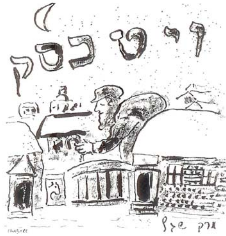
תמונה 5 ויטבסק, 1914 גואש ודיו הודי על נייר, 24.8x19.2 ס"מ אוסף פרטי