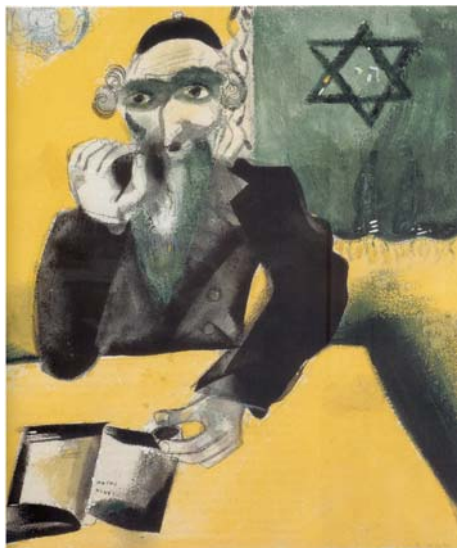
תמונה 3 מעל ויטבסק, 1923-24 צבעי מים על קרטון, 42.7x35 ס"מ אוסף פרטי מ.ב. כץ, מלוואקי, ארה"ב