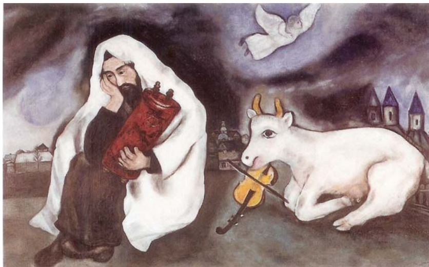
תמונה 2 בדירות, 1923-24 שמן על בד, 96x158 ס"מ מוזיאון תל-אביב לאמנות