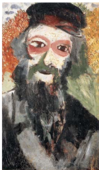
תמונה 4 האב, 1910-11 שמן על בד, 44.2x80 ס"מ המוזיאון לאמנות מודרנית, פאריס