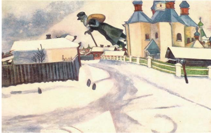
תמונה 1 מעל ויטבסק, 1914 שמן על בד, 73x92.5 ס"מ אוסף סם ואילה זקס, טורונטו, קנדה